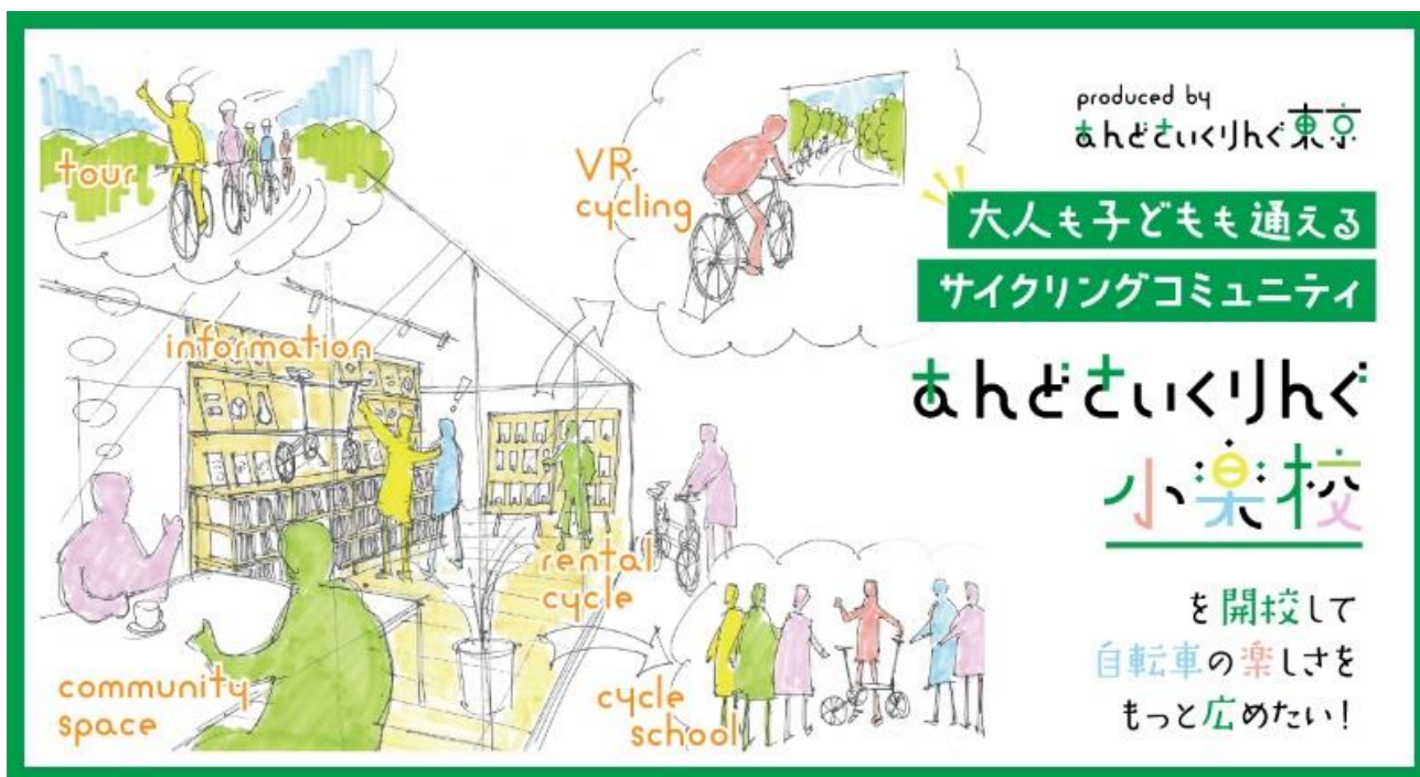
図 「あさ小」の活動イメージ

「あさ小」は、「も〜っと気軽に自転車を楽しむためのサイクリング複合拠点施設『あんどさいくりんぐ東京』」のメインとなる施設（サービス）です。「あさ小」のコンセプトは、「自転車生活の始め方と楽しみ方が学べる『大人も通えるサイクリングコミュニティ』」です。